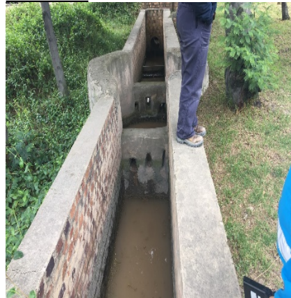
Fotografías 7 y 8: Instalación de filtros y cajas de pre-sedimentación antes de la descarga en el Punto PV1, comparación 2015 - 2018.