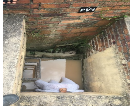
Fotografías 5 y 6: Punto PV1, lugar de descarga a la Quebrada Curí, comparación 2015 - 2018.