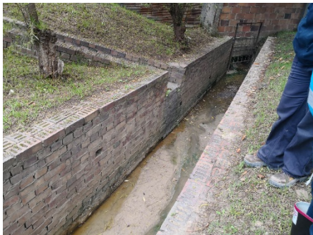
Fotografías 24, 25 y 26: Canalización del cauce de la Quebrada Curí, bajo la entrada vehicular de Ladrilleras Yomasa SA

Considerando lo anterior, se remitirá esta información a la Subdirección de Ecosistemas y Ruralidad y a la Subdirección de Control Ambiental al Sector Público para que, desde sus competencias en materia de impacto al cauce de la fuente superficial y del corredor ecológico de ronda, se analice esta situación y se tomen las acciones a que haya lugar desde el punto de vista técnico-jurídico (proceso Forest 3970868).