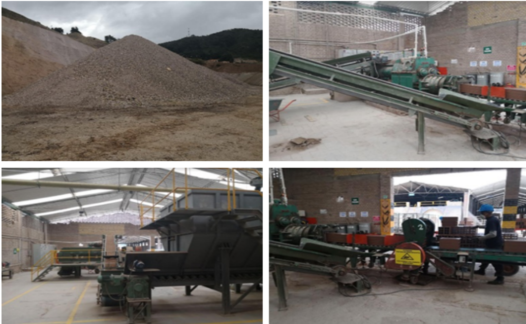
Fotografías 1, 2, 3 y 4. Algunas de las actividades que comprenden el proceso productivo de la sociedad Ladrilleras Yomasa SA

Las actividades desarrolladas por la sociedad LADRILLERAS YOMASA SA consisten en la explotación minera, que incluye, además, la trituración del material, su humectación y mezcla, continuando con el moldeo del producto en la extrusora, para luego ser cortado y secado. Posteriormente, se realiza la cocción de los ladrillos en hornos tipo Hoffman, utilizando como combustible carbón, que es alimentado por medio de un carbojet. Finalmente, el producto terminado es almacenado para su aprovechamiento, si es que el material se considera un producto de rechazo. Al realizar la visita se verifica que las actividades no han sido modificadas con respecto a las condiciones especificadas para la obtención del permiso de vertimientos.